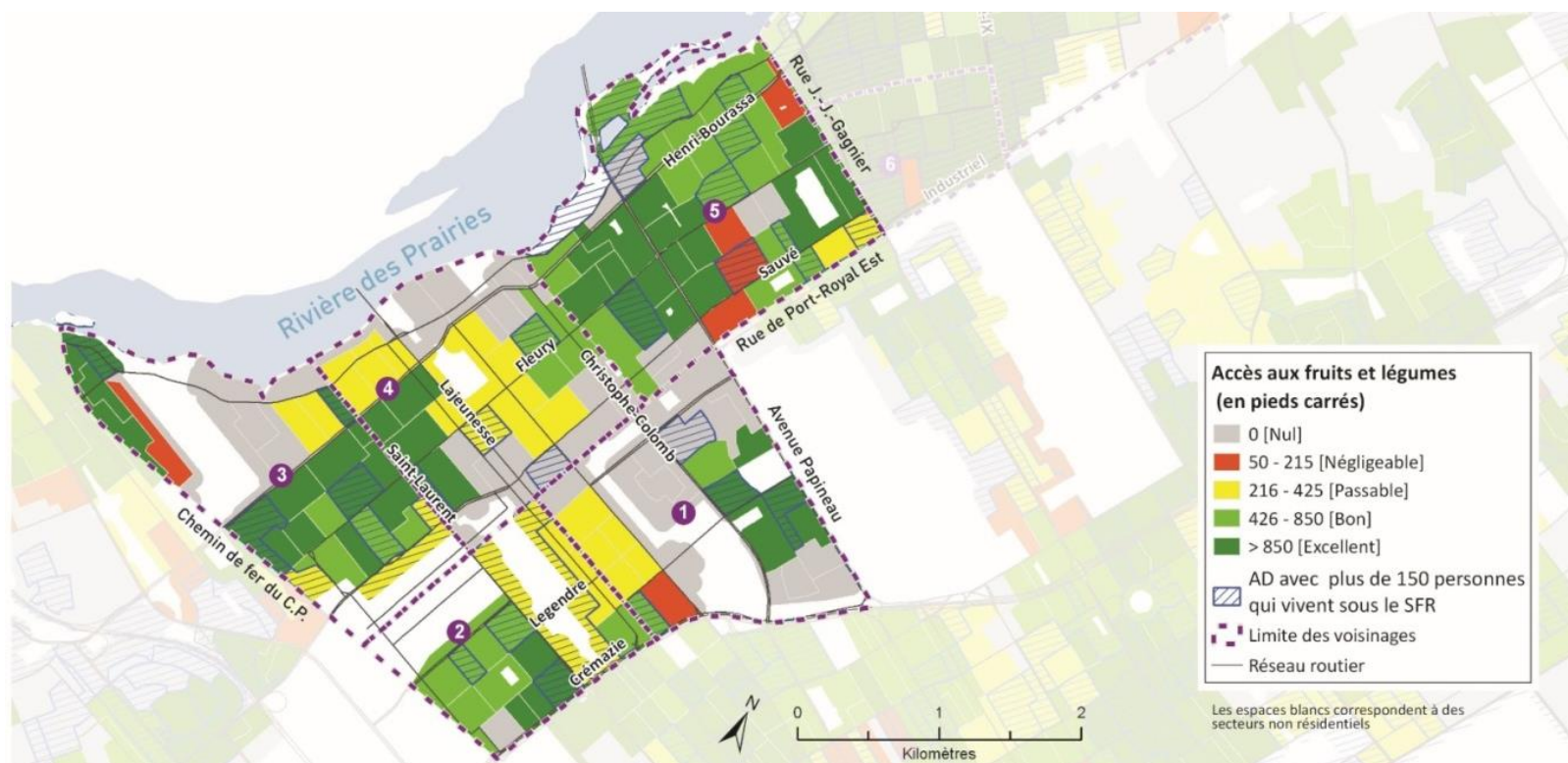
Carte 1 - Déserts alimentaires dans le quartier Ahuntsic (Modifiée à partir d'une carte de la Direction de santé publique, 2014)

Selon la Direction de la santé publique, on parle de désert alimentaire lorsque les résidents doivent faire plus de 500 mètres pour accéder à des denrées saines telles que les fruits et légumes, la viande, etc. La Carte 1 montre les endroits où cet accès est problématique, selon les données de 2014.